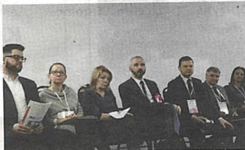
Uczestnicy panelu na temat rynku pracy

„U-rodziny” to ogólnopolskie spotkanie przedsiębiorców rodzinnych, które odbywają się nie tylko we własnym gronie, ale wspólnie z administracją rządową, przedstawicielami samorządów lokalnych oraz środowiskiem naukowym i eksperckim. Tegoroczna edycja zjazdu odbyła się po raz dziesiąty.